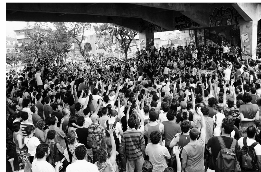
Img. 5 Assembleia Popular Horizontal (APH) no Viaduto Santa Tereza, Belo Horizonte

LUD: É uma característica, eu acho, da dinâmica de coletivização. Muitas vezes parece que precisa do conflito. Nem todo mundo dá conta de todas as lutas e de toda a tramitação e negociação que essas lutas demandam para além do momento da ação direta. Ficamos o ano todo tendo que lidar com a PBH para garantir algumas coisas básicas