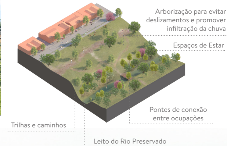
diagrama da solução interface ocupação - leitos dos rios+ nascentes