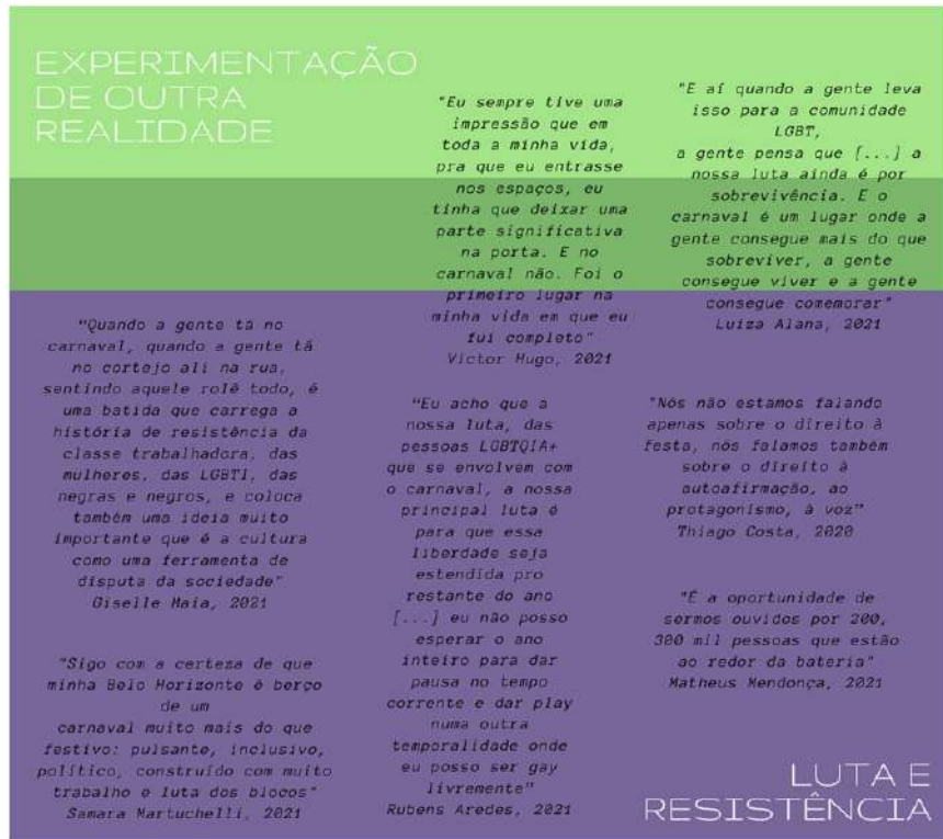
Figura 05: Narrativas LGBT+ sobre luta e resistência, interseccionadas, também, pela experimentação de outra realidade.

diretamente ligada às formas de luta e resistência identificadas através da festa e à importância da expansão dessa liberdade para outros momentos e locais, para que suas vozes e protagonismo possam reverberar para além, como pode ser observado na Figura 5. Esse carnaval alimenta a esperança da luta pela sobrevivência e pela autoafirmação de identidades e personalidades, que parece tão penosa em outros momentos.