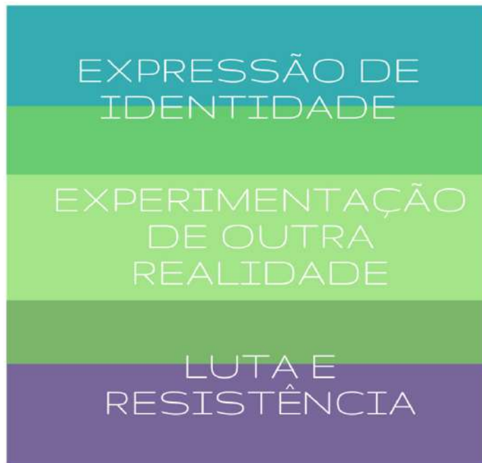
Figura 02: As narrativas denotam a experimentação de outra realidade, que se intersecciona com sensações de expressão de identidade e de luta e resistência.

Assim, a medida que as histórias foram sendo contadas, foi construído o fio principal que cartografa as narrativas, inspirado nas Situações, que propõe a experimentação de outra realidade, onde a expressão de sexualidades e de gêneros é vivida mais plenamente, com mais liberdade, contribuindo para a compreensão da força das paixões, sentimentos e emoções experienciados na festa. Também a partir das histórias foi possível perceber que a sensação de experimentar um novo imaginário de cidade se sobrepõe a outras vivências, lidas como permissividade na expressão de identidades e formas de luta e resistência. As leituras possíveis sobre as narrativas, contudo, não são limitadas, podendo ser construídas diferentes cartografias sobre os relatos. A Figura 2 ilustra a forma como foram cartografadas as narrativas, distribuídas entre essas sensações e percepções.