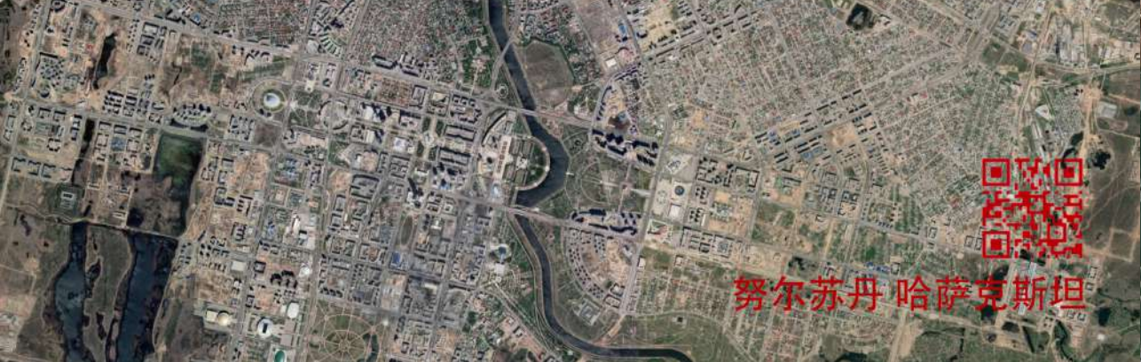
努尔苏丹 哈萨克斯坦